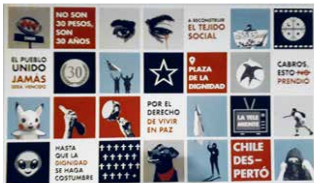
Figura 12: Tejedorxs varixs. A reconstruir el tejido social . Tapiz colectivo. 2019–2020 (Museo de Arte Popular Americano, Facultad de Artes, Universidad de Chile). 5