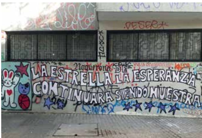
Figura 20: La estrella de la esperanza continuará siendo nuestra. Grafiti en barrio Lastarria