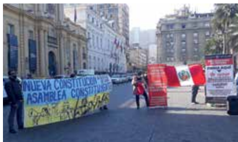
Figura 15: Huellas incas y mapuches en el cerro Santa Lucía.