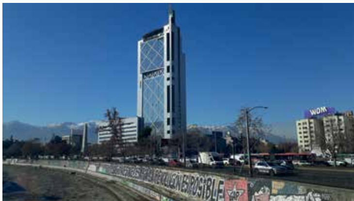
Figura 21: La revolución es necesaria y posible. Grafiti en costanera del río Mapocho.