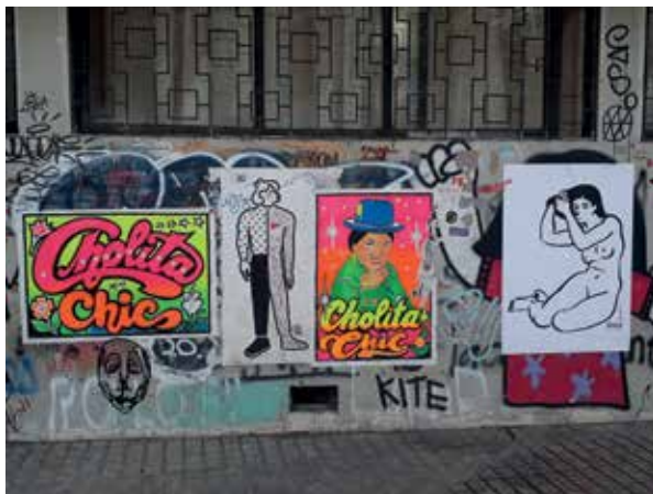
Figura 23: (In)Visibilizando cuerpos desnudos y vestidos. Afiches. Arte callejero en barrio Lastarria.