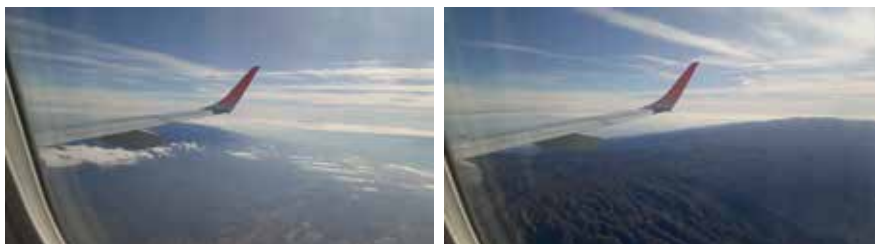
Figuras 1 y 2: Imágenes del vuelo desde Córdoba hacia Santiago de Chile.