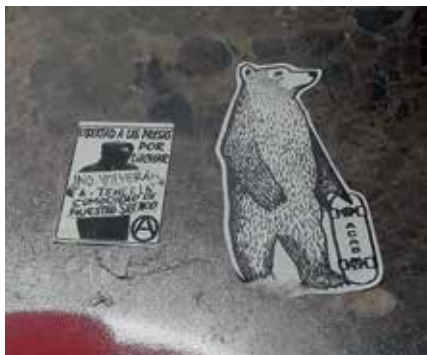
Figura 18: No volverán a tener la comodidad de nuestro silencio. Frases y figuras de pegatinas en paredes de Santiago de Chile.