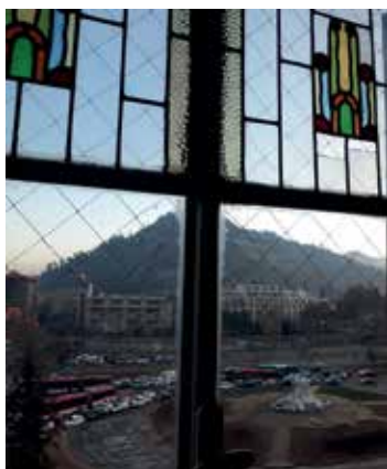
Figura 8: Vista del pedestal vacío, (ex) monumento al general Baquedano, plaza de la Dignidad. 4