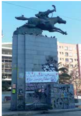
Figura 7: Si el mundo me rompe, lo rompo todo. Grafiti en monumento de barrio Providencia.