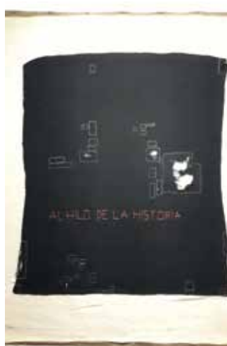
Figuras 13 y 14: Nury González, serie Sobre la Historia Natural de la destrucción . Manta mapuche tejida y teñida manualmente. 2011 (Museo de Artes Visuales, Universidad Católica de Chile). 6