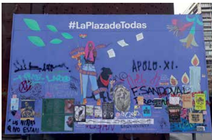
Figura 24: Por las niñas que no están. Cartel y grafitis en entrada a la estación de la Universidad Católica del Metro, Santiago de Chile.