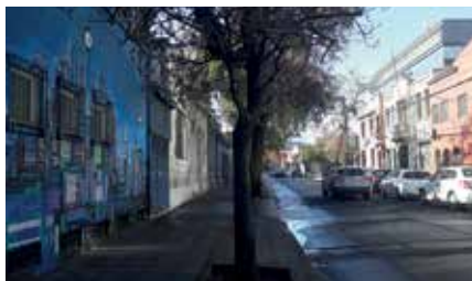
Figuras 9 a 11: Murales en calle Antonia Lope de Bello. Barrio Bellavista.