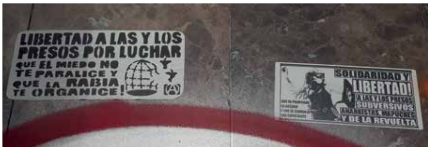
Figura 19: Que el miedo no te paralice...