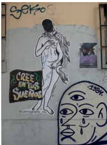
Figura 22: Venus enmascarada entre visiones y lemas. Ilustración digital impresa. Arte callejero en barrio Lastarria. 8